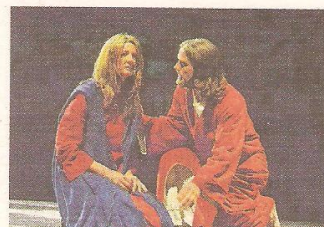
Aufgrund der großen Nachfrage wurden 4 Spieltermine im August eingeschoben.